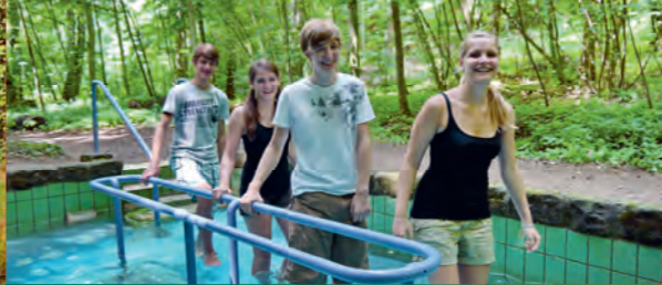
In der Kneippanlage