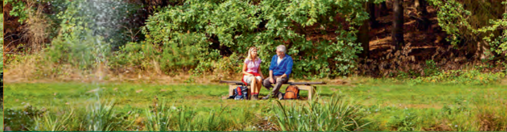
Am Fischweiher Merwoog