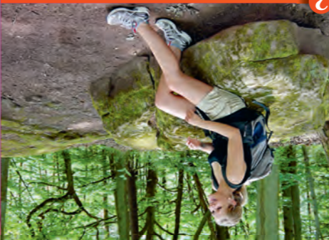
1 ▲ Schlossberghöhlen